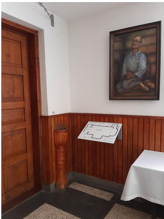
Drzwi z przedsionka do głównej nawy kościoła